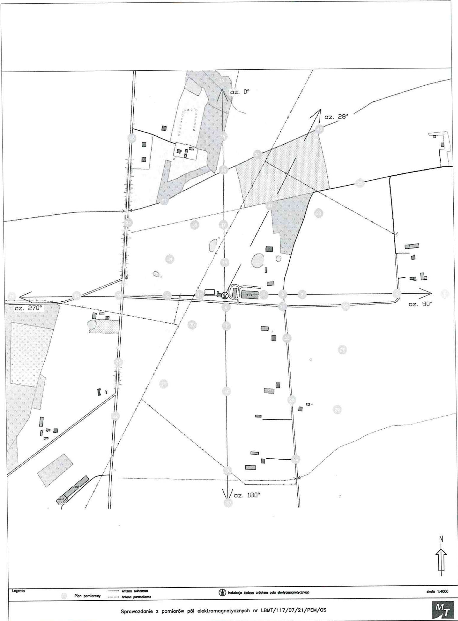
Rys.1 Lokalizacja pionów pomiarowych